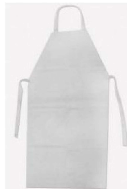
Avental de PVC com CA