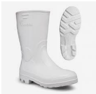
Bota de PVC com CA