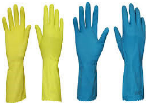
Luva de PVC com CA